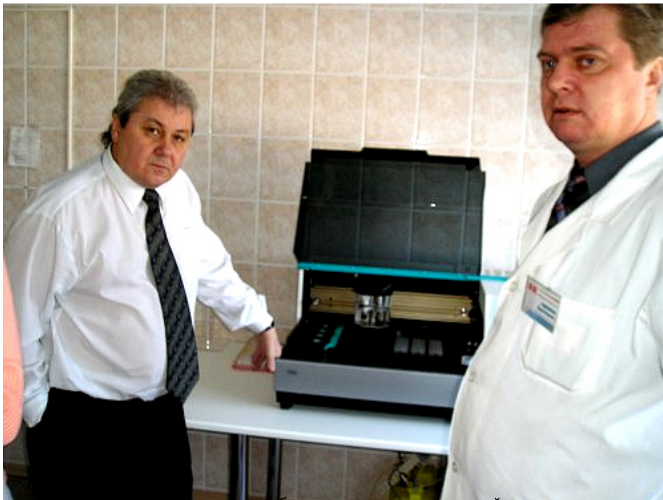
- Проведение широкого спектра биохимических исследований